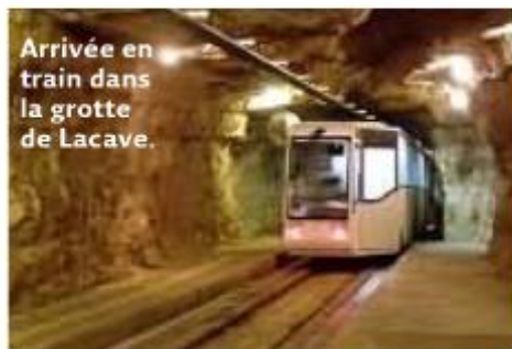
Arrivée en train dans la grotte de Lacave.

couvrir paysages insolites, paix et beauté même sous nos villes. Dans l'Oise, par exemple, à 5 kilomètres de Senlis, l'entrée d'une carrière de pierre abandonnée ouvre sur un autre monde. Un silence humide. Quelques mètres dans l'obscurité, et l'on ne sait plus où on est. Une incursion à faire avec un spéléologue passionné comme Pierre Savary : « Sous terre, on travaille deux facultés oubliées : l'orientation et la mémoire visuelle. En progressant, il faut arriver à se représenter un labyrinthe en 3D, plusieurs niveaux pouvant se superposer. » Tous les muscles du corps sont sollicités lors de ce « tai-chi souterrain où l'on cherche des appuis, mais aussi un terrain de jeux. » ■ Fliette de Crozet