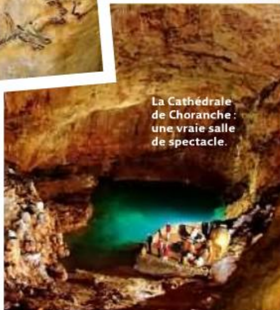
La Cathédrale de Choranche : une vraie salle de spectacle.