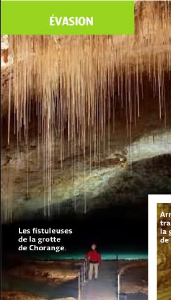
Les fistuleuses de la grotte de Chorange.